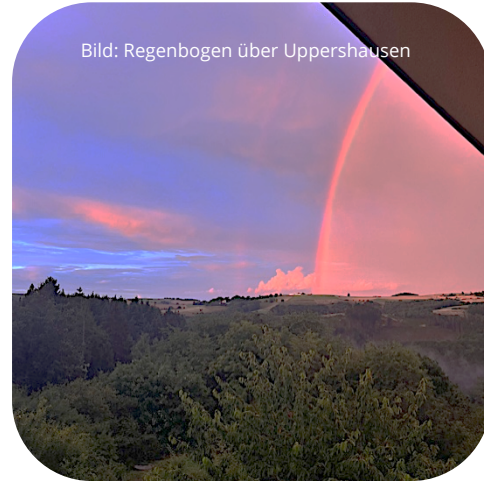
Regenbogen über Uppershausen