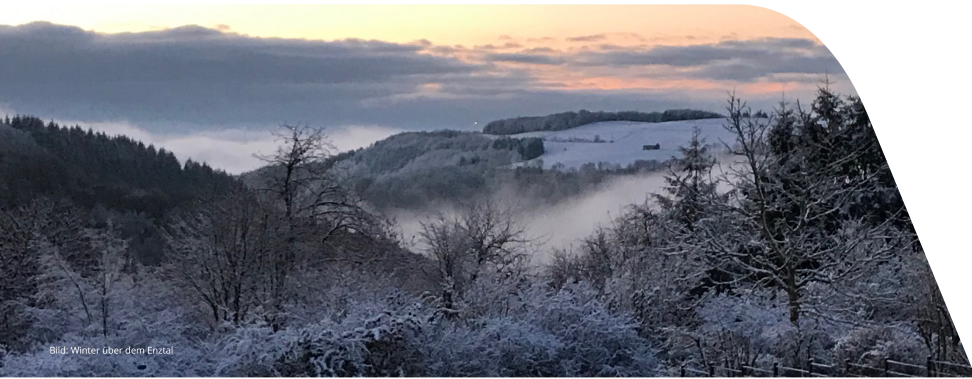
Bild: Winter über dem Enztal

Um den Start in die neue Praxis für den/die Praxiserwerber/in zu erleichtern und sein finanzielles Risiko zu minimieren kann eine Earn-out-Klausel vereinbart werden.