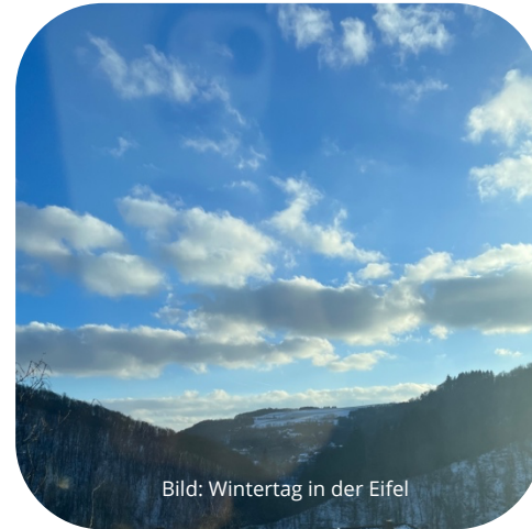
Bild: Wintertag in der Eifel