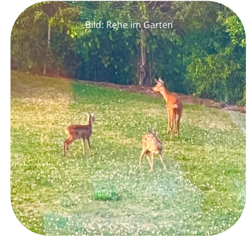
Bild: Rehe im Garten