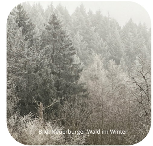
Bild: Neuerburger Wald im Winter