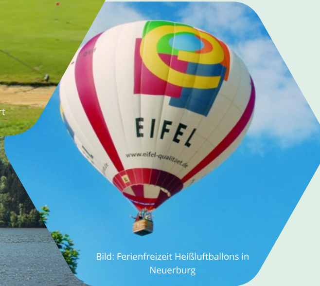
Bild: Ferienfreizeit Heißluftballons in Neuerburg