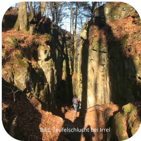
Bild: Teufelschlucht bei Irrel