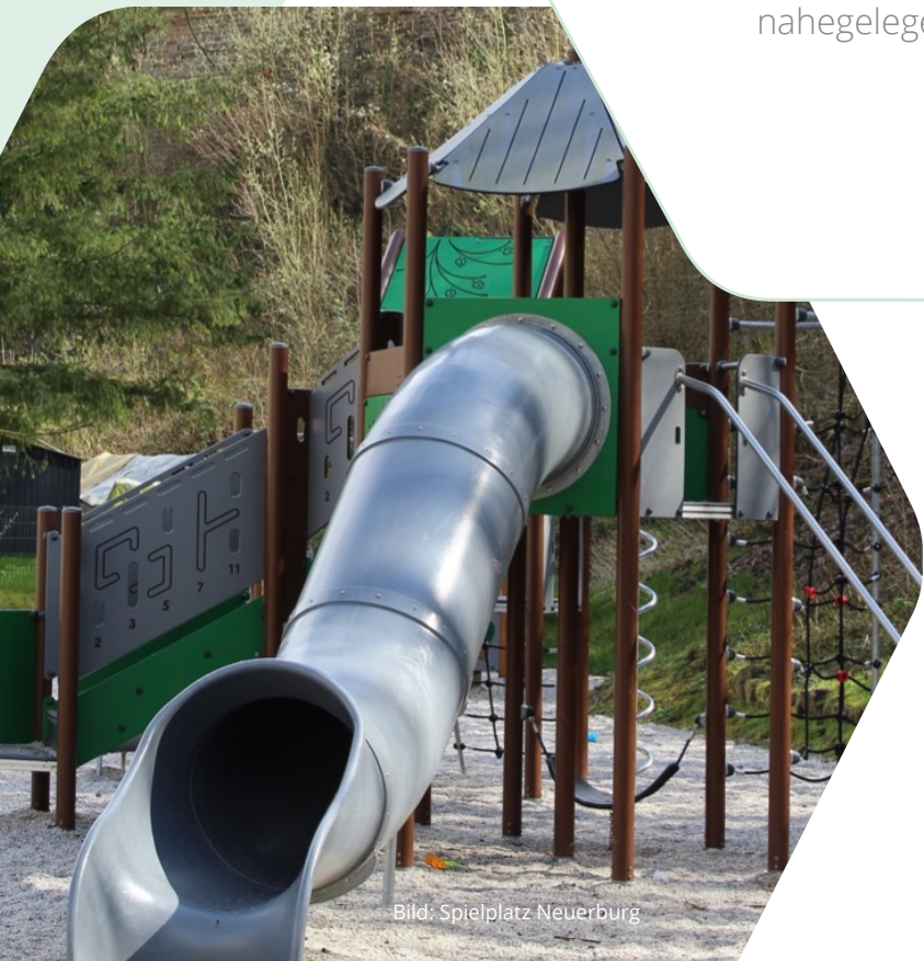
Bild: Spielplatz Neuerburg