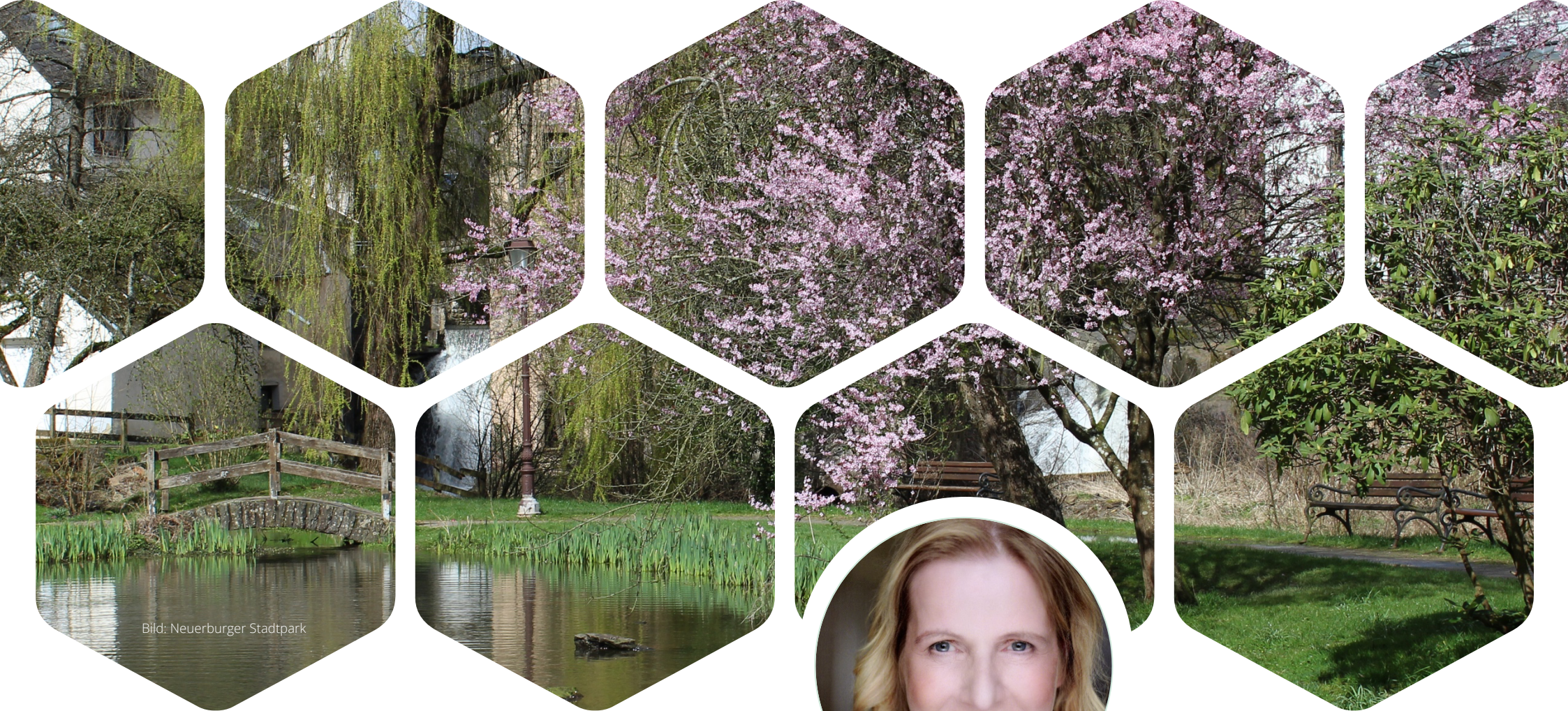
Bild: Neuerburger Stadtpark