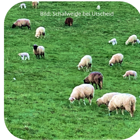
Bild: Schafweide bei Utscheid