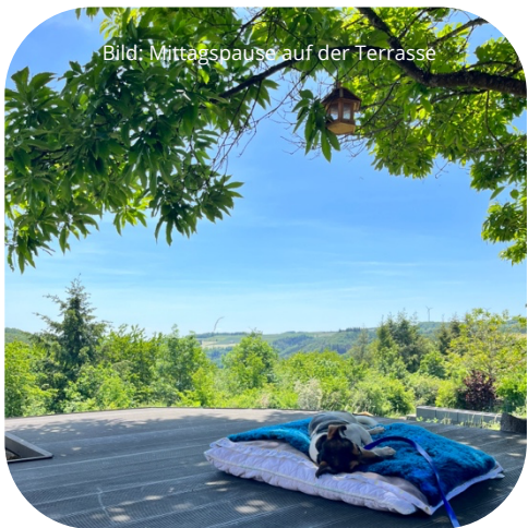
Bild: Mittagspause auf der Terrasse