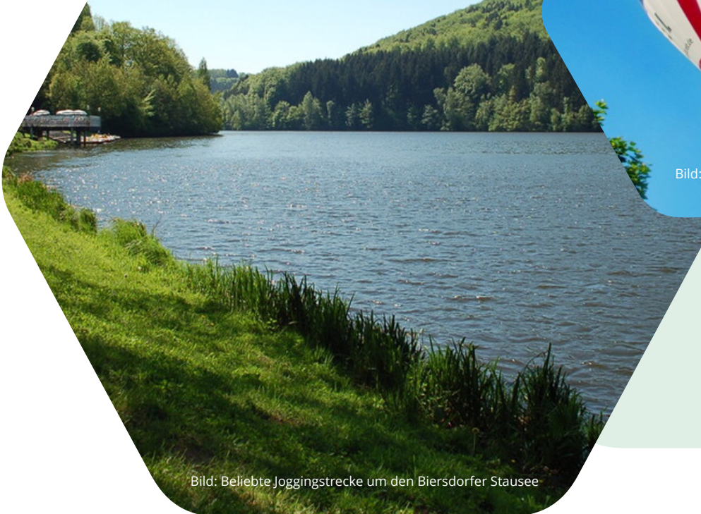
Bild: Beliebte Joggingstrecke um den Biersdorfer Stausee